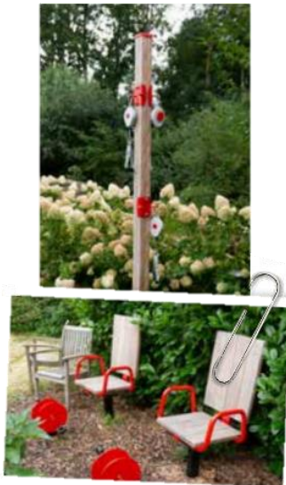
Afbeelding 1: Feestelijke opening tuinkas

Dit verslag wordt tevens openbaar gemaakt op onze website: http://zorgboerderijbuitengewoon.nl/